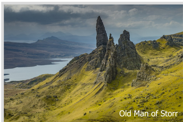
Old Man of Storr

Erlebt „Natur pur“ in den schottischen Highlands und auf der Isle of Skye. Ob bei Regen, Nebel oder Sonnenschein, wir sind bei jedem Wetter draußen! Unsere locations sind das durch den Film „Highlander“ bekannte Eilean Donan Castle und viele sehens- und fotografierenswerte Punkte auf der Insel wie z. B. der Hafenort Portree, die Sligachan-Bridge, Loch Coruisk (Bootsfahrt), das Fairy Glen, die Talisker Bay, Bracadale, die Fairy Pools und der wunderschön an der Westspitze gelegene Leuchtturm Neist Point. Und dass wir eine Wanderung zum Old Man of Storr machen, ist ja wohl selbstverständlich!