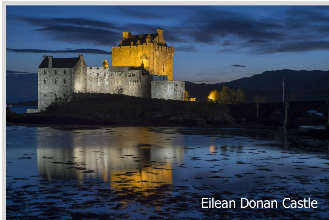
Eilean Donan Castle

Unsere Gastgeber Sarah und Stuart verwöhnen uns auf Wunsch auch mit leckerem Abendessen. Da das Haus lediglich 5 Zimmer besitzt und maximal 8 Personen darin wohnen können, ist eine schnelle Buchung ratsam. An Zimmern stehen zur Verfügung: 2 Zimmer mit Doppelbett, 1 Zimmer mit zwei Einzelbetten (twin) und 2 Zimmer mit Einzelbetten. Bilder der Zimmer gibt's auf der Haus-Homepage . Alle Zimmer bis auf das eine Einzelzimmer (nur Dusche; das WC - zur Alleinnutzung - ist auf dem Flur) sind mit Badewanne oder Dusche und WC (nennt sich „en Suite“).